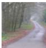
Ancienne voie romaine