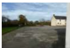
Aire de jeux et parking