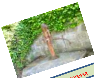
La Pompe de la paresse